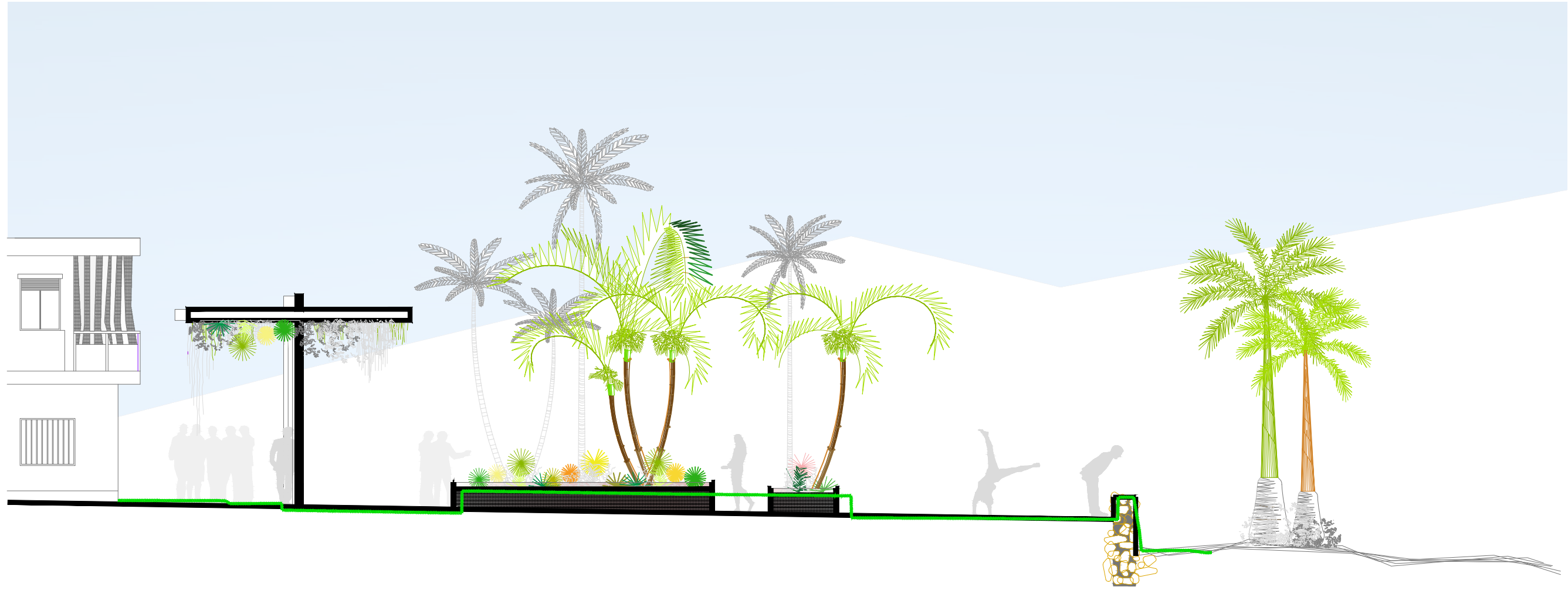
SECCIÓN A-A (VER PLANO 1.1 HOJA 1 DE 7)'. E: 1/100